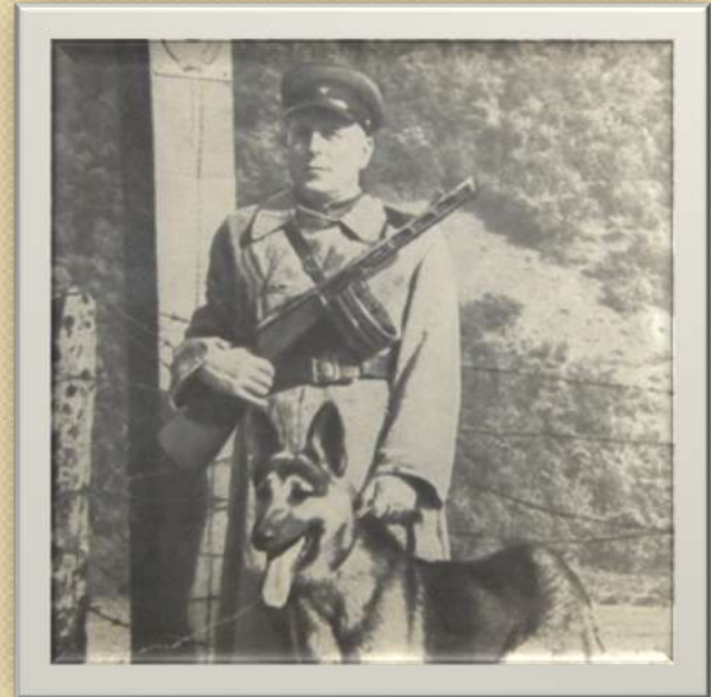
Служба на заставе