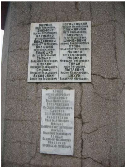
д. Ярмоличи, памятник землякам, погибшим в годы Великой Отечественной войны