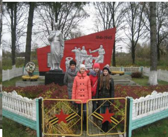
д. Малая Берестовица, памятник землякам, погибшим в годы в годы Великой Отечественной войны