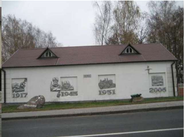
Надпись на мемориальной доске памятника в д. Луцковляны