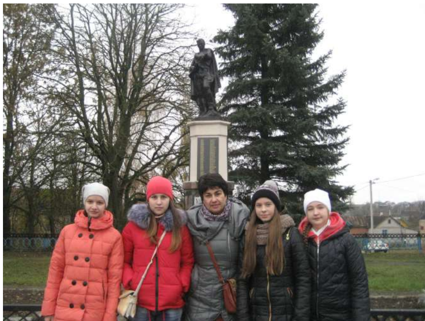
д. Индура, братская могила советских воинов